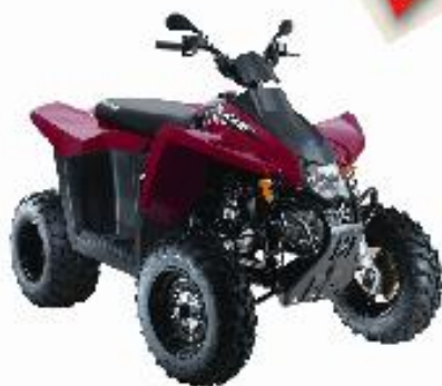
Trail Boss 330