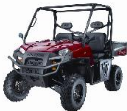
RANGER 800 HD.