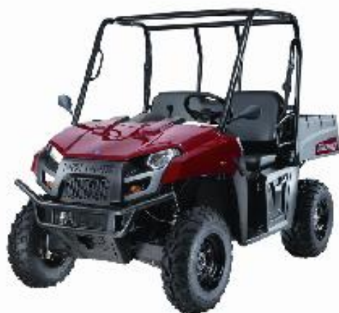
RANGER EV (Electrique)